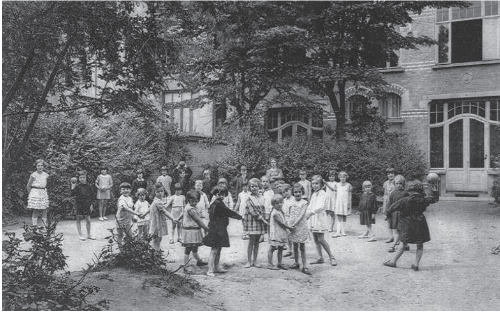
«Un coin de jardin», carnet de «cartes détachables» imprimé par les «frères Nels»