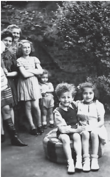
Le jardin © Fredda Rapoport